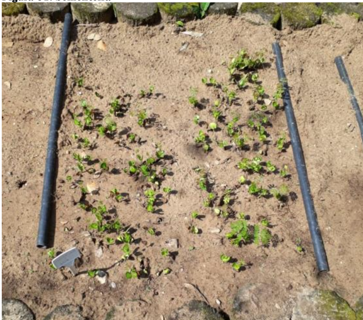
Figura 01: Sementeira