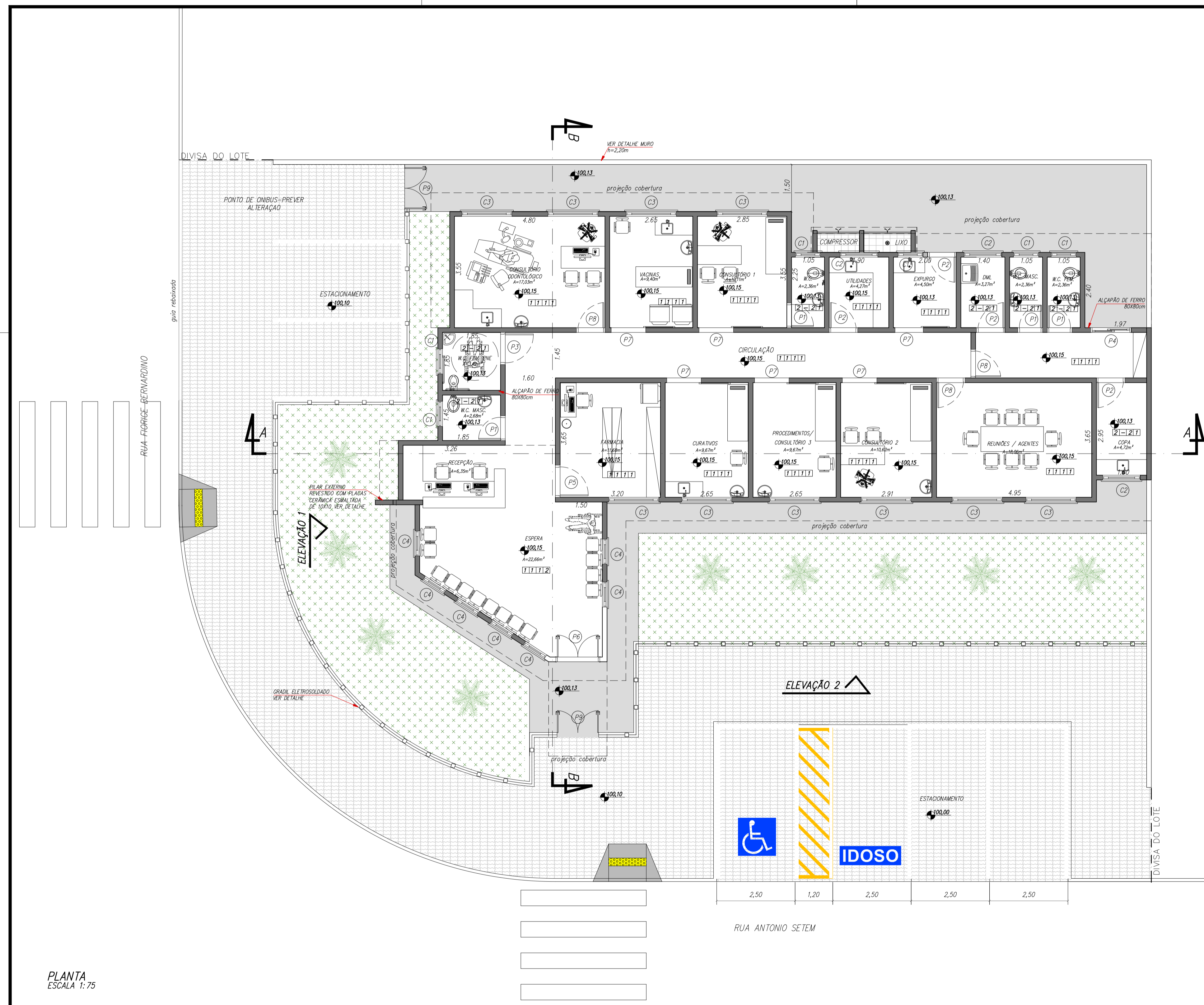
PLANTA ESCALA 1:75

Observações: 1 - As dimensões devem ser verificadas e aprovadas em 3D. 2 - Todas as portas devem conter 100% de pigmentação.