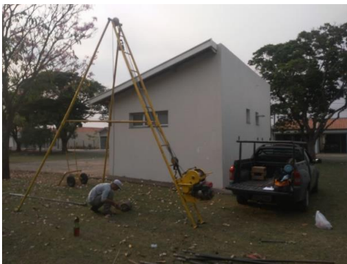
Foto 05 - Acompanhamento de sondagem