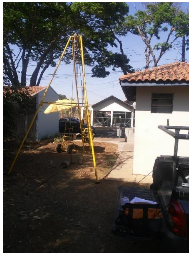
Foto 02 - Acompanhamento de sondagem