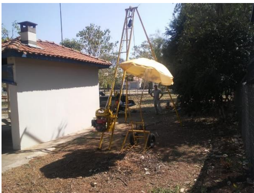
Foto 01 - Acompanhamento de sondagem