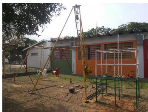
Foto 04 - Acompanhamento de sondagem