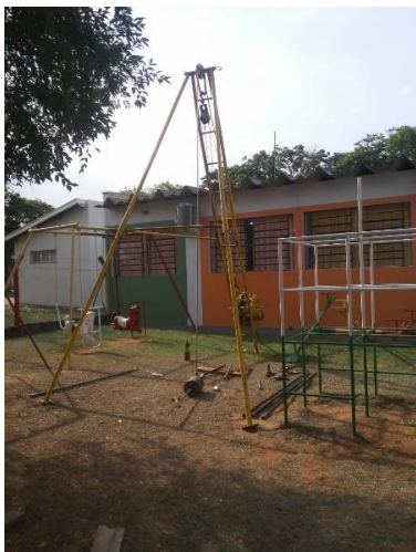
Foto 03 - Acompanhamento de sondagem