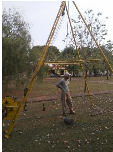
Foto 06 - Acompanhamento de sondagem