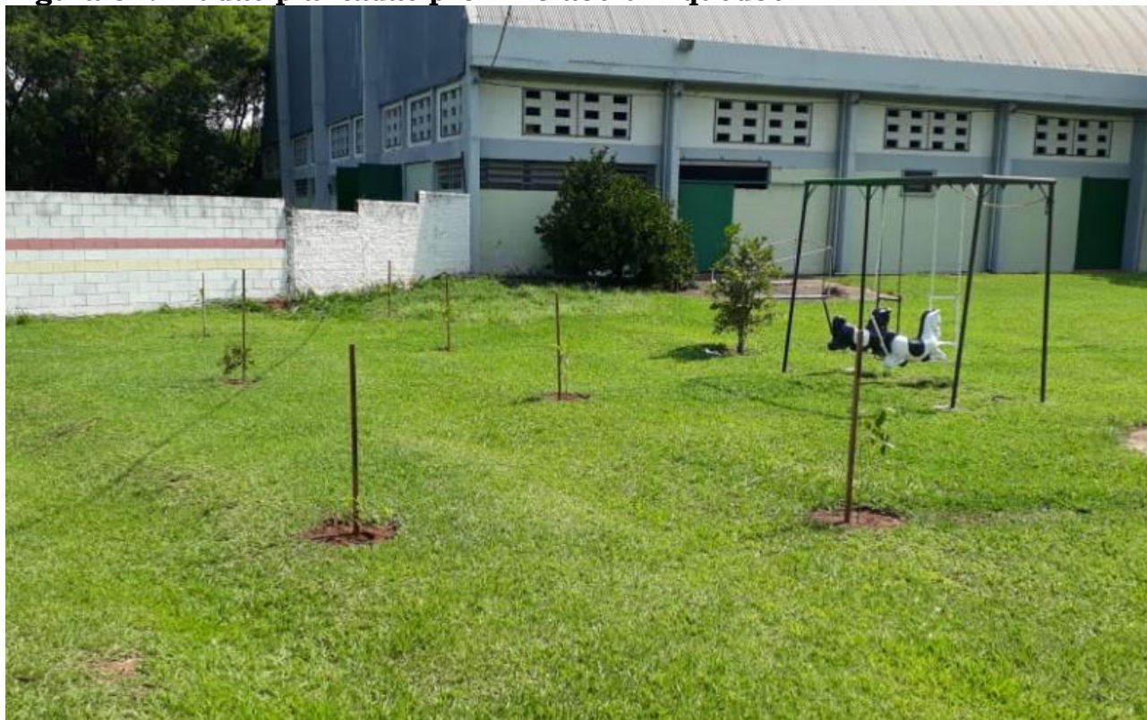
Figura 01: mudas plantadas próximo aos brinquedos