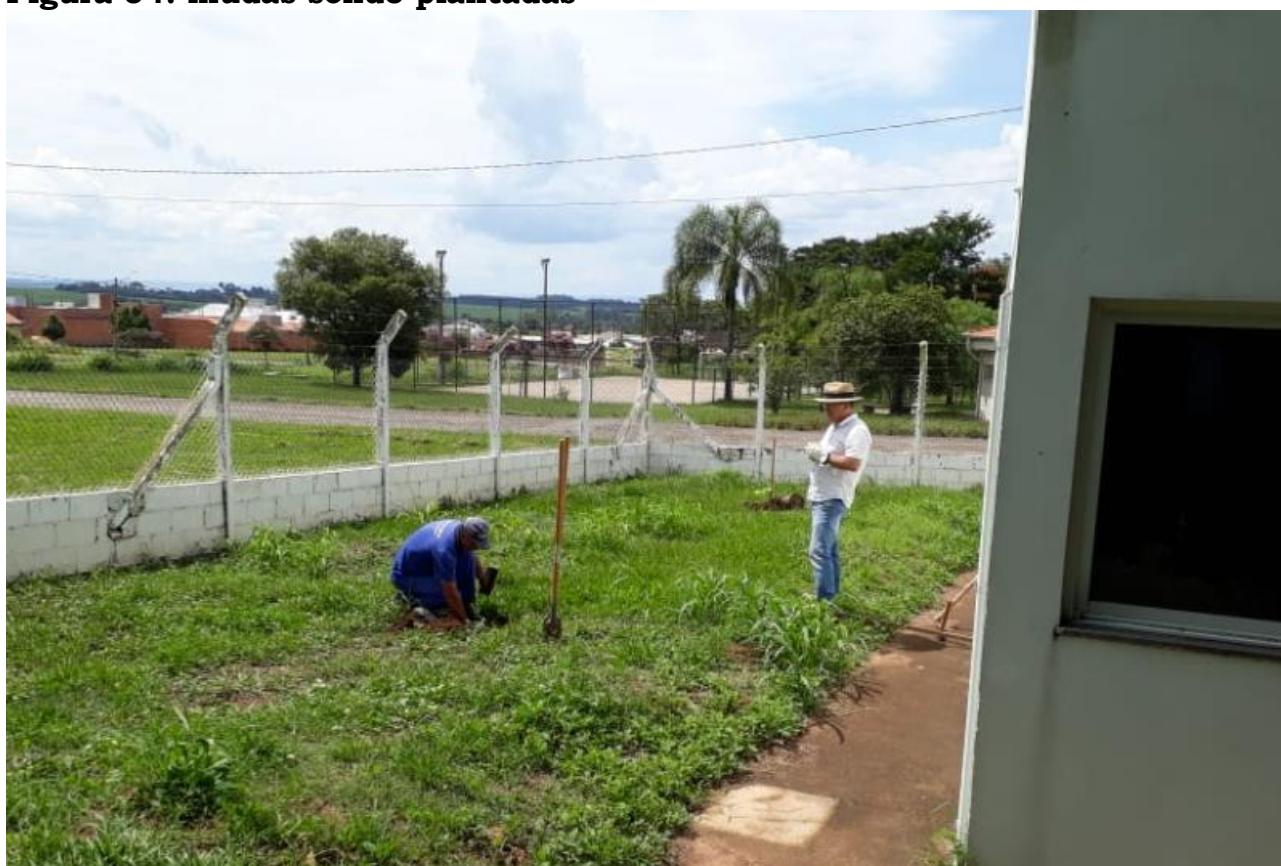
Figura 04: mudas sendo plantadas

Em 26 de janeiro de 2021, foram plantadas 04 mudas nas dependências do Centro de Lazer do Idoso no bairro Azaléas, sendo elas: 1 ipê roxo, 2 ipês branco e 1 jacarandá caroba. A ação visa melhorar o ambiente, trazendo mais conforto térmico das áreas livres do local.