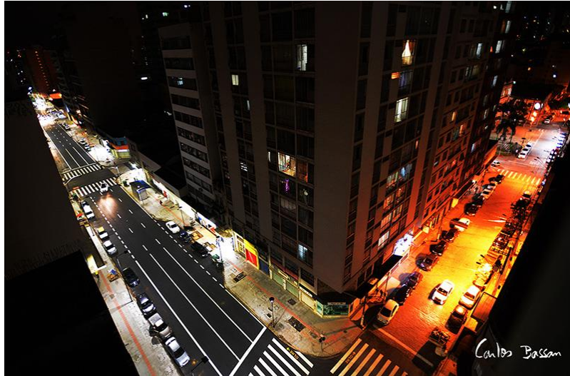
Figure 3 - Imagem Av. Fonte