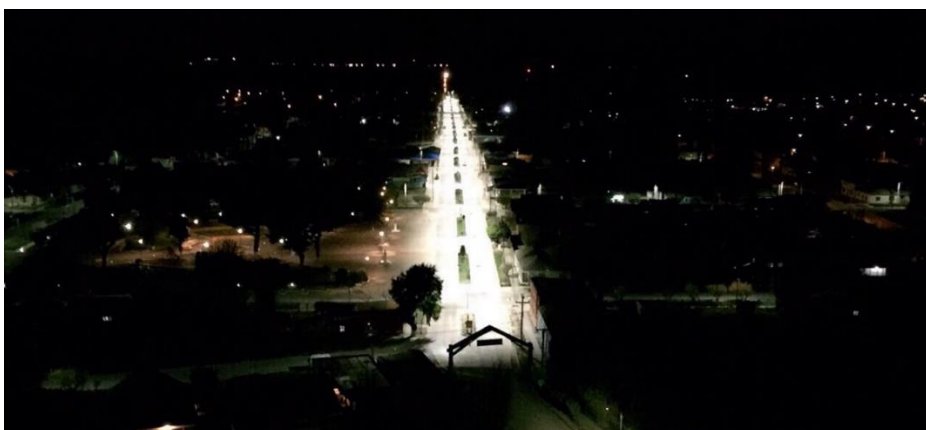
Figure 1 - Foto de instalação.

A importância da iluminância média é a proposição de se evitar um nível excessivo de iluminação acima do requerido pela regulamentação normativa.