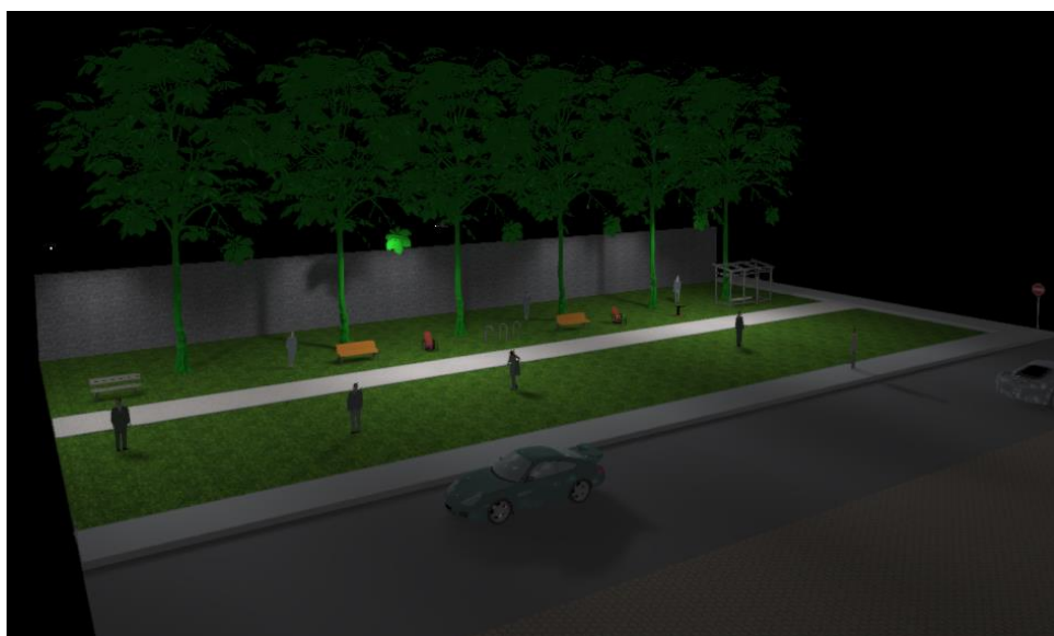
Figure 8 - Vista.