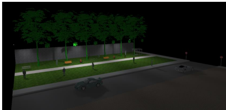
Figure 5 - Vista da praça