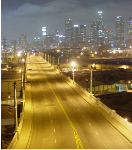
Figure 2 - Tecnologia de Sódio. Efeito Zebra.