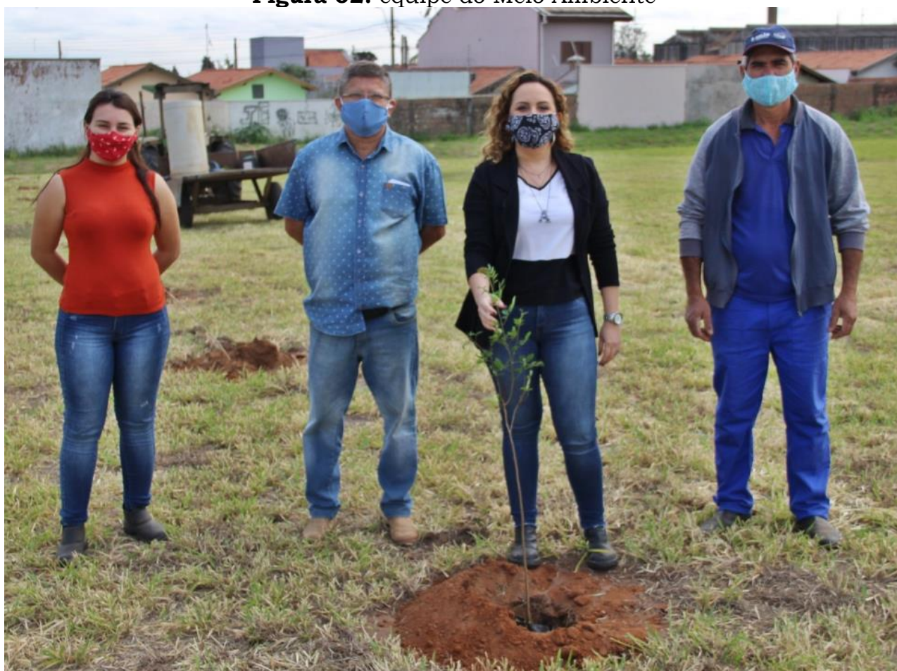
Figura 02: equipe do Meio Ambiente

A atividade teve como objetivo seguir com a cultura de preservação ambiental, implementada desde 2017, aumentando a arborização.